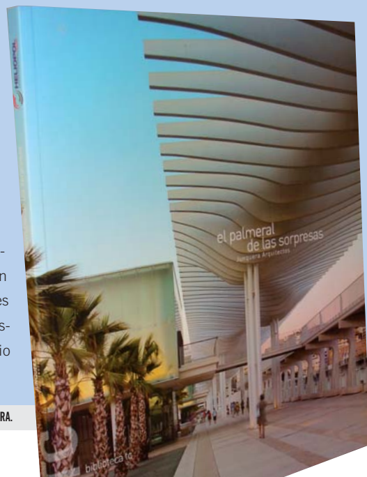
HELIOPOL HA PARTICIPADO EN LA REALIZACIÓN DE UN LIBRO MONOGRÁFICO SOBRE LA OBRA.