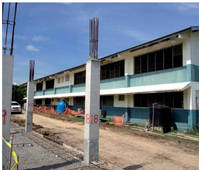
El centro educativo San Carlos cuenta con un presupuesto superior al millón de dólares.