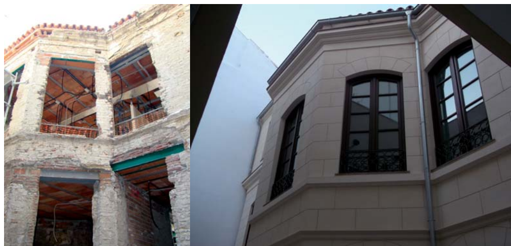
Las obras de rehabilitación han supuesto la recuperación de un edificio histórico de la capital malagueña.

La actuación, que Heliopol ha desarrollado a través de la UTE constituida con MLR Construcciones, ha conllevado la adaptación del edificio a un uso expositivo combinado con otro tipo de dependencias, como son espacios de oficinas y entretenimiento.