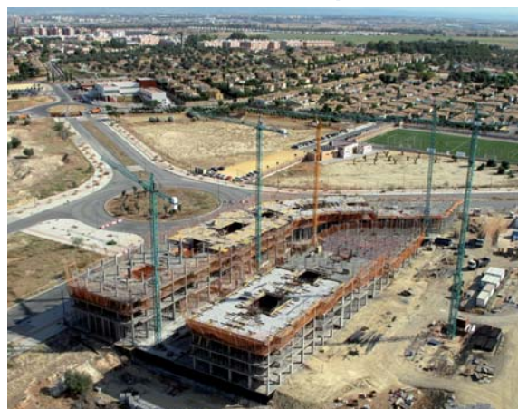
La estructura de Novaquinto 2 ya ha superado el séptimo forjado.

El éxito de esta promoción se debe a la combinación de un gran producto a un gran precio, ubicado en la ampliación natural del barrio de Montequinto, en Dos Hermanas (Sevilla).