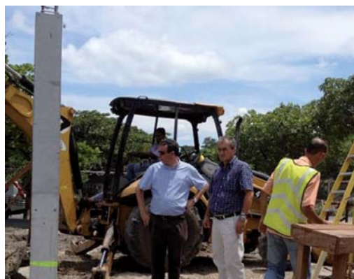
Los técnicos españoles de Heliopol a cargo de las obras.