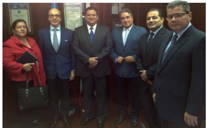
Firma de contrato para la construcción del gimnasio San José.