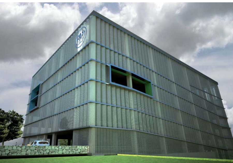
Clínica del Doctor Villarino en Panamá.