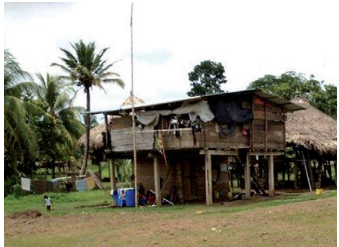
El centro educativo Lajas Blancas se ejecutará en la comarca indígena EmberaWounaan.

Centro Recreacional para Ancianos, que cuenta con un presupuesto superior a los cuatro millones de U.S.D. y un plazo de ejecución de 18 meses, y el Centro de Atención Promocional y Preventivo de Salud (CAAPS) de Vacamonte, que está al 15% de la ejecución y estará terminado durante los primeros meses de 2013.