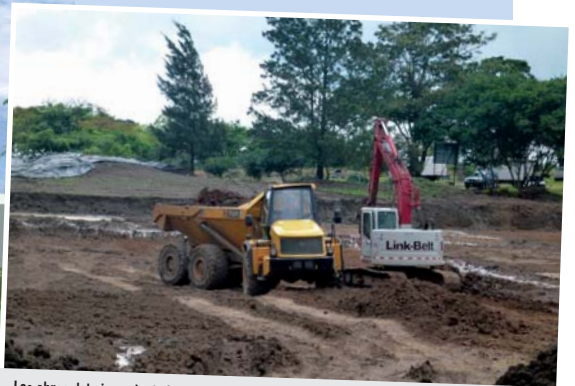
Las obras del gimnasio de la ciudad deportiva de San José han comenzado recientemente.

Desde que le fuera adjudicada la primera obra a Heliopol en Costa Rica, la calle Barrio Johnny Ramírez, en la provincia de San José, la constructora se ha esforzado por continuar su expansión en