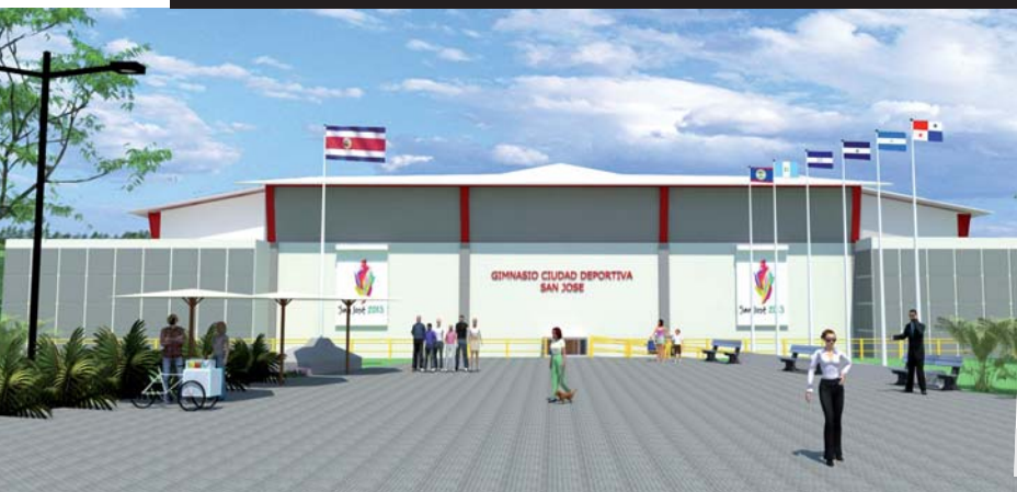
El nuevo gimnasio de la ciudad de San José será clave en el desarrollo de los Juegos Deportivos Centroamericanos.